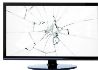
Flachbildschirme mit kaputter Scheibe