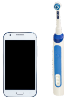
Geräte mit festverbauten Akkus oder Batterien