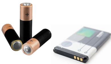
Lose Akkus oder Batterien

Aus Sicherheitsgründen ausgenommen sind Geräte mit festverbauten Akkus oder Batterien, Glühbirnen und Flachbildschirme mit kaputter Scheibe. Aus rechtlichen Gründen ausgenommen sind auch schuleigner oder Elektroschrott aus Firmen .