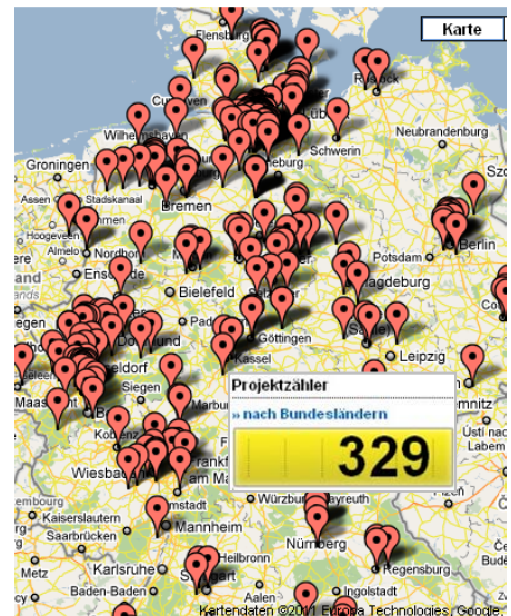
Schulen mit Projekten in deiner Nähe

Schulen zum Erfahrungsaustausch findest du auf einer Landkarte. Wie viele in deinem Bundesland sind, kannst du mit dem Projektzähler auf der Homepage erkunden. Die komplette Liste bekommst du über Alle Projekte . Die Liste kannst du sortieren oder durchsuchen , z.B. nach PLZ oder Ort. Wenn du gezielt nur Projektberichte anderer ansehen möchtest, dann wähle unter filtern Berichte/Fotos/Video „ mit Projektbericht “. Zur Info: Für Projekte, die noch auf der alten Website angemeldet wurden, war der Projektbericht noch nicht verpflichtend. Jetzt kann er online selbst eingegeben werden. Auch mit Fotos usw.